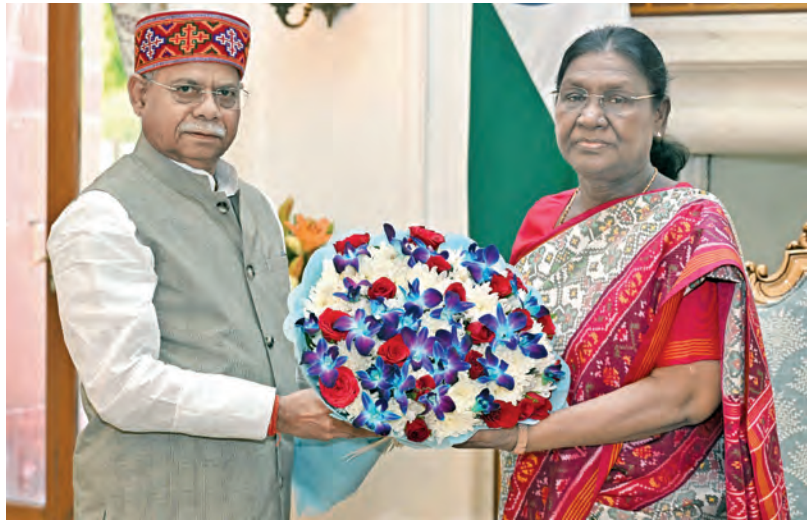
శుక్రవారం న్యూఢిల్లీలో రాష్ట్రపతి ద్రౌపది ముర్మును కలిసిన తెలంగాణ గవర్నర్ శివప్రతాప్ శుక్లా