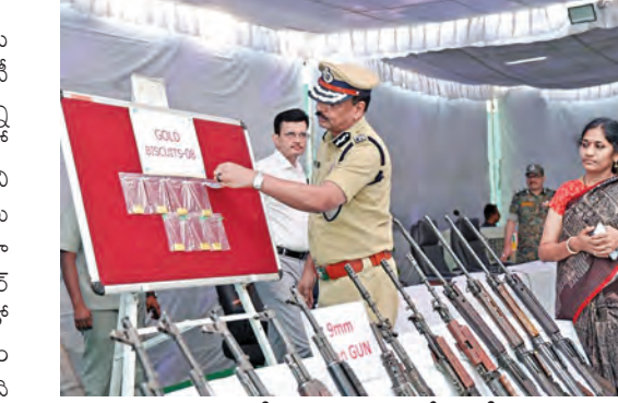
శుక్రవారం మామోయిస్తున్న నుంచి స్వాధీనం చేసుకున్న

లొంగిపోవడం వెనుక ఎన్ఐబి పోలీసుల కృషి వుందని డిజిబి తెలిపారు. లొంగిపోయిన వారి తెలంగాణ రాష్ట్రం తరపున కోటి 93 లక్షల రూపాయల రివార్యుతో పాటు కేసీ ప్రం అందించనున్న రివార్యు వసూలని డిజిబి తెలిపారు. వీరంతా జనజీవన ప్రపంచంలో కలిసి గౌరవంగా కుటుంబ సభ్యులతో కలిసి జీవించేలా చూస్తామని ఆయన హామీ ఇచ్చారు. నక్కలైట్లు స్వాధీనం చేసిన ఆయుధాలు సాయుధ బలగాలు చెందినవేసిన డిజిబి తెలిపారు. వీటిని ఆయా విభాగాలకు అందజేస్తామని ఆయన తెలిపారు. 2023 డిసెంబర్ నెల నుంచి ఏదానినైనా కాలంలో 761 మంది 302 ఆయుధాలతో లొంగిపోయారు, ఇదిపోలీసుల సమీక్షకృషి వల్ల సాధ్యమయ్యింది అని ఆయన వెల్లడించారు. ఈ ఏడాది ఇప్పటి వరకు 205 మంది 206 ఆయుధాలతో లొంగి పోయారని డిజిబి తెలిపారు.